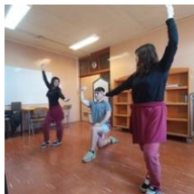
Raíces de Chile: Un Viaje Artístico en la Fiesta de la Chilenidad