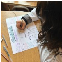
Geopolítica de la Guerra Fría a través de Mapas Históricos