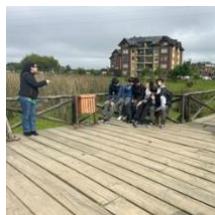
DDHH en la vida cotidiana y en el entorno natural