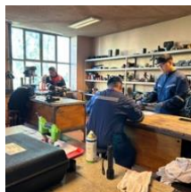
Práctica de Extracción de Rodamientos