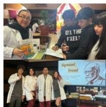
Corrientes Filosóficas: Investigación y Diálogo